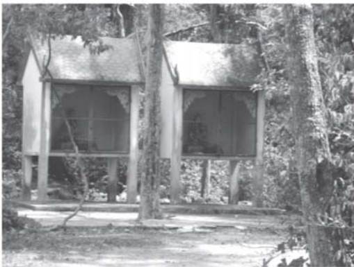
รูปที่ 2 หอปูตาซึ่งเป็นที่อยู่ของปูดและใช้ประกอบพิธีกรรม

การอนุรักษ์ป่าวัฒนธรรมจะอาศัยความเชื่อและความศรัทธาที่มีต่อผีปูดผู้มีพลังอำนาจในการดลบันดาลให้เกิดความสุข ความทุกข์ ปกป้องอันตรายจากสิ่งร้ายทั้งปวง ความเชื่อเป็นพื้นฐานของอำนาจในการกำหนดกฎเกณฑ์และข้อห้ามต่างๆ ที่กำหนดความสัมพันธ์ระหว่างมนุษย์กับมนุษย์ และมนุษย์กับธรรมชาติแวดล้อม ซึ่งชาวบ้านได้นำเอาความเชื่อผีปูดและพิธีการเลี้ยงผีปูดมาเป็นสื่อในการปลูกจิตสำนึกรักษาป่า และต่อยอดความผูกพันทางจิตวิญญาณระหว่างคนและชุมชนกับธรรมชาติ จนกระทั่งชาวบ้านมีความเข้าใจและเข้ามามีส่วนร่วมในการอนุรักษ์ป่า และยังรักษาจารีตประเพณี ความเชื่อ และพิธีกรรมเกี่ยวกับผีปูดและป่าวัฒนธรรมที่สอดคล้องกับการอนุรักษ์ทรัพยากรป่าไว้เป็นสมบัติของท้องถิ่น