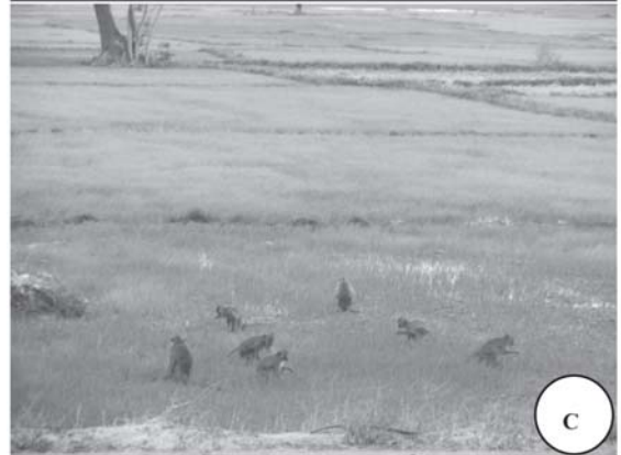
รูปที่ 3 ความขัดแย้งระหว่างลิงหางยาวกับมนุษย์