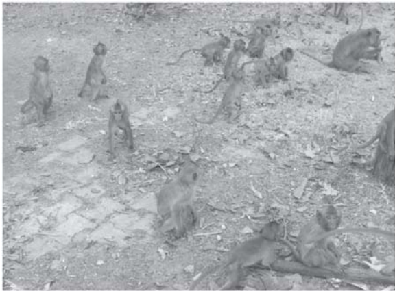
รูปที่ 6. ประชากรลิงหางยาวในวัยเด็ก

เนื่องจากลิงหางยาวสามารถผสมพันธุ์ได้ทั้งปี ทำให้ประชากรลิงเพิ่มขึ้นอย่างต่อเนื่อง โดยเฉพาะประชากรลิงหางยาวในวัยเด็ก (รูปที่ 6) ดังนั้นจะต้องมีการควบคุมจำนวนประชากรลิงโดยการทำหมันในลิงหางยาวเพศผู้และฝังยาคุมกำเนิดในลิงหางยาวเพศเมีย แต่ลิงหางยาวเป็นสัตว์สังคม มีการแบ่งชั้นภายในฝูง ซึ่งการทำหมันเป็นการกำจัดแหล่งสร้างฮอร์โมน ทำให้ความแข็งแกร่งและความก้าวร้าวหมดไป จึงไม่สามารถสู้กับเพศผู้ตัวอื่นๆ ได้ และถูกขับออกจากฝูงในที่สุด สำหรับในเพศเมียการฝังยาคุมกำเนิดนั้น ยังมีข้อมูลน้อย จึงมีความเสี่ยงถ้าหากหากขนาดของยาที่ใช้กลับมีผลตรงข้ามกระตุ้นให้เกิดการตกไข่มากขึ้น [5]