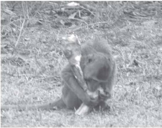
รูปที่ 4 ลิงหางยาวกำลังกินรากพืช

การพึ่งพาระหว่างลิงหางยาวกับป่าวัฒนธรรมนั้น ลิงหางยาวได้ใช้ประโยชน์จากป่าไม่ว่าจะเป็นแหล่งที่อยู่อาศัย แหล่งอาหาร และแหล่งสืบพันธุ์ โดยเฉพาะแหล่งอาหารนั้นถือได้ว่าเป็นปัจจัยที่สำคัญอันดับหนึ่ง จากการสังเกตพบว่าลิงหางยาวที่อาศัยในป่าวัฒนธรรมแห่งนี้ จะออกมาหาอาหาร 2 ช่วงคือ ในช่วงเช้าตั้งแต่พระอาทิตย์ขึ้นจนถึงเวลาประมาณ 11.00 น. แล้วกลับเข้าไปพักผ่อน และออกมาหาอาหารอีกครั้งในเวลาประมาณ 14.00 น. จนถึงเวลาพระอาทิตย์ตก อาหารหลักที่ลิงหางยาวกินได้แก่ พืช ส่วนของพืชที่ลิงหางยาวกินนั้นจะกินทั้งส่วนที่เป็นราก (รูปที่ 4) ลำต้น ดอก ผล และเมล็ด รวมทั้งแมลงและสัตว์ขนาดเล็กอื่นๆ ที่อาศัยอยู่ในป่าแห่งนี้ด้วย