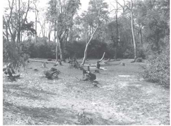
รูปที่ 7. บ่อน้ำชั่วคราวที่แห้งขอดในฤดูแล้ง

การบริหารจัดการพื้นที่ป่าวัฒนธรรมแห่งนี้ควรมีหน่วยงานต่างๆ ไม่ว่าจะเป็นประชาชนในพื้นที่ องค์การปกครองส่วนท้องถิ่น และหน่วยงานเอกชน เข้ามามีส่วนร่วมในการบริหารจัดการพื้นที่ โดยการจัดสรรงบประมาณในการเพิ่มพื้นที่ป่าเพื่อเป็นแหล่งน้ำและแหล่งอาหาร รวมทั้งควบคุมประชากรของลิงหางยาวในพื้นที่ เพื่อให้เกิดความสมดุลระหว่างแหล่งน้ำ แหล่งอาหารและจำนวนประชากรลิงหางยาว อันจะก่อให้เกิดความยั่งยืนของอุทยานวานรต่อไป