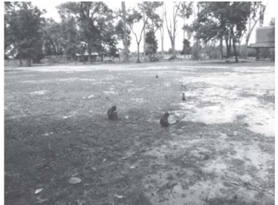
รูปที่ 8. พื้นที่ว่างเปล่าบริเวณอุทยานวานร