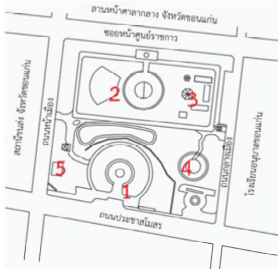
ภาพที่ 3 การใช้ประโยชน์พื้นที่ภายในสวนรัชดานุสรณ์ รูปแบบของกิจกรรมและผู้ใช้พื้นที่ในสวนรัชดานุสรณ์

การใช้ประโยชน์พื้นที่โดยทั่วไปของสวนรัชดานุสรณ์ แบ่งเป็นสัดส่วนได้คร่าวๆ คือ ส่วนแรก เป็นส่วนที่เป็นสวนและอนุสาวรีย์ต่างๆ ซึ่งจะอยู่ด้านทิศใต้ของพื้นที่ ส่วนที่สอง เป็นส่วนของลานกิจกรรมและพื้นที่สนามเด็กเล่น จะอยู่ด้านทิศเหนือของพื้นที่ ส่วนที่สาม เป็นส่วนของศูนย์การเรียนรู้ อยู่ด้านทิศตะวันออกเฉียงเหนือของพื้นที่ ส่วนที่สี่ เป็นพื้นที่ออกกำลังกาย อยู่ด้านทิศตะวันตกของพื้นที่ ส่วนที่ห้า เป็นพื้นที่สถานีตำรวจ อยู่ทิศตะวันตกเฉียงใต้ของพื้นที่