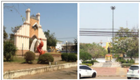
ภาพที่ 1 หอนาฬิกาของเมืองขอนแก่นและอนุสาวรีย์จอมพลสฤษดิ์ ธนะรัชต์ ที่ตั้งอยู่ภายในพื้นที่สวนรัชดานุสรณ์

สวนรัชดานุสรณ์เป็นพื้นที่สาธารณะที่มีความเป็นสวนธรรมชาติ อยู่ใกล้สถานีขนส่งและศูนย์ราชการของเมืองขอนแก่น ซึ่งเป็นพื้นที่สาธารณะที่มนุษย์สร้างขึ้น อีกทั้งยังเป็นที่ตั้งของอนุสาวรีย์จอมพลสฤษดิ์ ธนะรัชต์ และหอนาฬิกาของเมืองขอนแก่น จึงนับได้ว่า พื้นที่สวนรัชดานุสรณ์มีความสำคัญต่อพื้นที่เมืองขอนแก่นในทุกด้าน จึงควรมีการศึกษาและเสนอแนะแนวทางการพัฒนาพื้นที่เพื่อให้เกิดประโยชน์ต่อเทศบาลนครขอนแก่นให้มากที่สุด