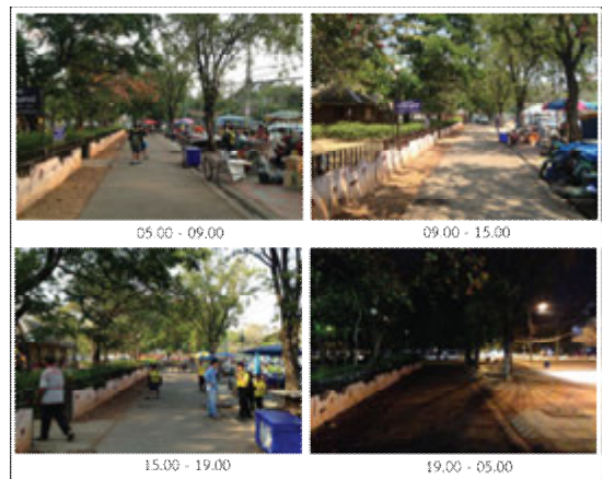
ภาพที่ 4 ลักษณะทางกายภาพและกิจกรรมในแต่ละช่วงเวลา

ด้านผู้ใช้พื้นที่ จะเห็นว่าพื้นที่สวนรัชดานุสรณ์เป็นพื้นที่ที่ผู้คนสามารถเข้ามาใช้ เดินผ่าน หรือมองเห็นได้สะดวก อีกทั้งพื้นที่สวนรัชดานุสรณ์อยู่ติดกับพื้นที่สถานีขนส่งของจังหวัดขอนแก่น จึงทำให้มีประชากรที่หลากหลายเข้ามาใช้พื้นที่ แต่โดยส่วนมากจะเป็นการเดินทาง ผู้ใช้พื้นที่เป็นประจำส่วนมากจะเป็นผู้ให้เช่าพระ พ่อค้า แม่ค้า และคนเร่ร่อนเป็นส่วนใหญ่