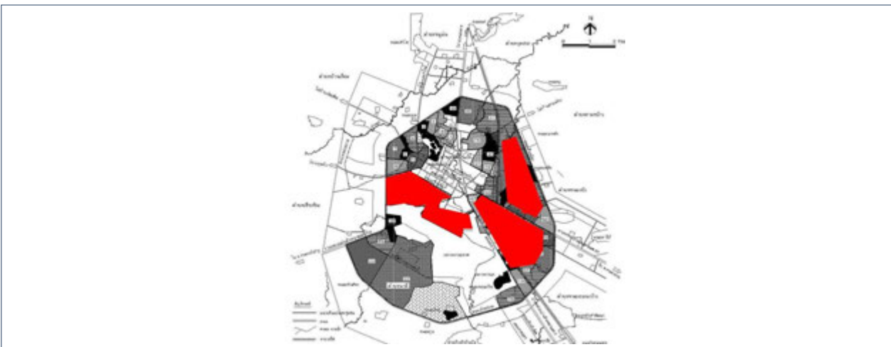
ภาพที่ 1 พื้นที่บริเวณชุมชนแออัดในเขตเทศบาลนครอุดรธานี

การศึกษารั้วนี้ ได้ทำการศึกษาชุมชนผู้มีรายได้น้อยในโครงการบ้านมั่นคงในเขตเทศบาลนครอุดรธานี ทั้ง 6 โครงการ ในด้านการประเมินคุณภาพความเป็นอยู่ภายหลังจากได้รับการพัฒนาตามแนวทางโครงการบ้านมั่นคง ซึ่งได้แก้ปัญหาความไม่มั่นคงในการอยู่อาศัย โดยเน้นการแก้ปัญหาชุมชนผู้มีรายได้น้อยแบบภาพรวมทั้งเมือง