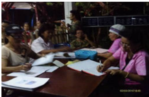
ภาพที่ 6 ระบบการออมทรัพย์ของสมาชิกในโครงการบ้านมั่นคง