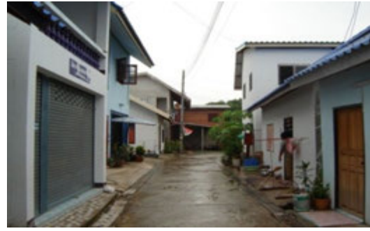
ภาพที่ 5 การพัฒนาที่อยู่อาศัยในชุมชน

ผลจากการศึกษาพบว่า ระบบสาธารณูปโภคและสาธารณูปการ มีความเพียงพอและไม่เป็นปัจจัยหลักในการพัฒนาเพื่อคุณภาพการอยู่อาศัยดีขึ้น เนื่องจากเป็นความจำเป็นพื้นฐานของชุมชนที่ต้องได้รับการพัฒนาอยู่แล้ว ขณะที่องค์ประกอบทางกายภาพอื่น ได้แก่ การจัดการขยะ ทางเท้า ทางจักรยานและการพักผ่อน จำเป็นต้องได้รับการปรับปรุงเพื่อให้คุณภาพการอยู่อาศัยดีขึ้น ต้องมีระบบการกำจัดขยะที่มีประสิทธิภาพ เพิ่มระบบทางเท้า ทางจักรยาน และปรับปรุงองค์ประกอบด้านกายภาพ เพื่อช่วยให้ทำกิจกรรมพักผ่อนได้สะดวกมากยิ่งขึ้น