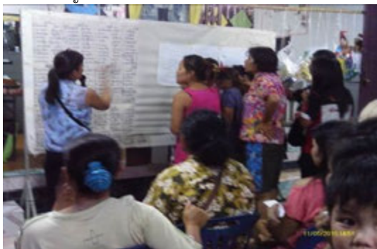
ภาพที่ 3 การมีส่วนร่วมในการพัฒนาของสมาชิกในชุมชน

ผู้แทนชุมชนมากกว่าร้อยละ 80 เห็นว่าในภาพรวมกิจกรรมเกี่ยวกับชุมชนเข้มแข็งทั้ง 10 กิจกรรม มีส่วนทำให้ชุมชนในโครงการเข้มแข็งขึ้น เพราะกิจกรรมดังกล่าวได้สร้างความสามัคคีและมีการแลกเปลี่ยนความคิดเห็นของคนในชุมชน ผู้นำหรือคณะกรรมการตลอดจนลูกบ้านรับบทบาทของตนเองในการอยู่ร่วมกันในชุมชน (ภาพที่ 3) มีการตื่นตัวในระบอบประชาธิปไตย ชาวชุมชนมีความรู้ความเข้าใจในการแก้ไขปัญหาในชุมชน ตลอดจนทำให้เกิดความสัมพันธ์ที่ดีระหว่างผู้นำกับชาวชุมชนและระหว่างชาวชุมชนด้วยกันเอง ส่วนผู้แทนชุมชน ร้อยละ 17 ยังเห็นว่ากิจกรรมดังกล่าวไม่มีส่วนทำให้ชุมชนเข้มแข็งขึ้นเนื่องจากบางส่วนยังขาดความรู้ความเข้าใจเกี่ยวกับชุมชนที่ถูกต้อง มีการให้ความร่วมมือกับกิจกรรมในชุมชนน้อย แบ่งออกเป็นฝักเป็นฝ่าย คำนึงถึงผลประโยชน์ตัวเองหรือพวกพ้องเป็นหลัก ไม่ให้ความสำคัญกับกิจกรรมของคนในชุมชน และความหลากหลายของคนที่เข้ามาอยู่ในชุมชนทำให้เกิดปัญหาขึ้น