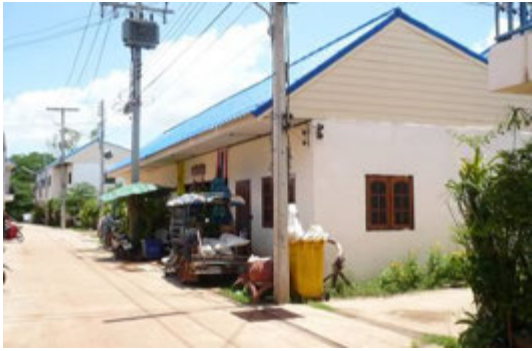
ภาพที่ 4 การปรับปรุงระบบสาธารณูปโภคในชุมชน