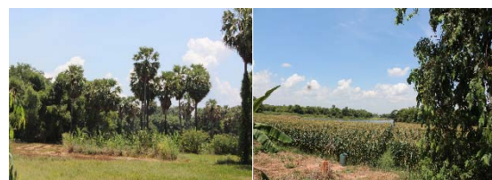
ภาพที่ 1 บริบทชุมชนและทุนทางวัฒนธรรม-ภูมิปัญญาท้องถิ่น

5.1 ในการแลกเปลี่ยนเรียนรู้ข้อมูลพื้นฐานของชุมชน เพื่อนำไปเป็นแนวทางในการจัดการองค์ความรู้และการสร้างอาชีพในชุมชนอย่างยั่งยืน จากการสัมภาษณ์ การลงพื้นที่จริง พูดคุยกับชาวบ้าน ราษฎรชาวบ้าน ผู้นำชุมชน พบว่า หมู่บ้านในอำเภอชุมแสง โดยเฉพาะตำบลเกยไชย ส่วนใหญ่เป็นพื้นที่ที่มีการปลูกต้นตาลเป็นจำนวนมาก เพื่อผลิตน้ำตาลสด ซึ่งเป็นองค์ความรู้ของภูมิปัญญาชาวบ้านและเป็นอาหารพื้นบ้านที่สืบทอดต่อกันมาสู่รุ่นลูกหลาน นับเป็นสิบๆ ปี ซึ่งลูกหลานยึดเป็นอาชีพและแหล่งหารายได้พิเศษ นอกจากนี้พื้นที่อีกบางส่วนมีภูมิปัญญาในการผลิตไข่เค็ม การทอพรหมเช็ดเท้า การผลิตแชมพูสระผมสมุนไพร และการจักสานจากไม้ไผ่ ผักตบชวาและหวาย โดยการใช้อุปกรณ์เพื่อใช้ในการดำรงชีวิตและการประกอบอาชีพ เช่น เครื่องใช้ในครัวเรือน ได้แก่ เสื่อลำแพน ตระกร้า เป็นต้น ซึ่งลักษณะหรือวิธีการถ่ายทอดความรู้นั้นจะเป็นในรูปแบบของการฝึกฝนและหัดสอนแบบผู้ใหญ่ จากพ่อสู่ลูก ผ่านวิธีการบอกเล่าปากต่อปาก การปฏิบัติจริงจากฝึกฝนของบรรพบุรุษ และการฝึกปฏิบัติจริงจากการสังเกต โดยเน้นเป้าหมายของการถ่ายทอดไปที่ทายาทเป็นหลัก ต่อมาในช่วงแรกภูมิปัญญาการจักสานไม่มีหลักฐานที่ปรากฏเป็นลายลักษณ์อักษรที่ชัดเจน