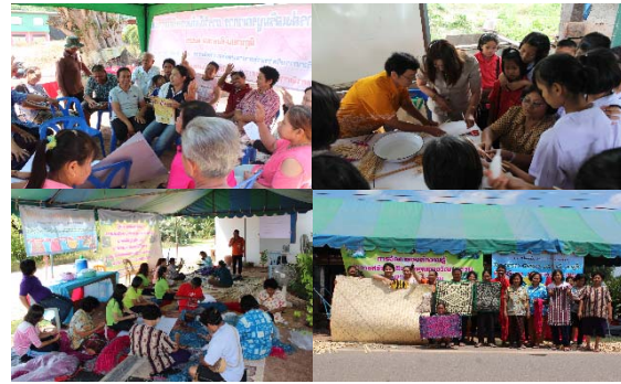
ภาพที่ 3 การดำเนินการสร้างอาชีพที่สอดคล้องกับบริบทชุมชน

5.3 การดำเนินการสร้างอาชีพเสริมที่สอดคล้องกับบริบทของชุมชนอย่างครบวงจรเพื่อแก้ไขปัญหาความยากจนอย่างยั่งยืน จากปัญหาที่ทำให้ชาวบ้านเกิดความยากจน นักวิจัย ชาวบ้าน ผู้นำชุมชน ประชาชน ชาวบ้าน จึงได้ร่วมมือกันจัดเวทีชาวบ้าน โดยมีกระตมความคิดกัน ก็สรุปว่า จะต้องมีการสร้างอาชีพจากสิ่งที่เป็นวัฒนธรรมและภูมิปัญญาท้องถิ่นแบบการพึ่งตนเอง ซึ่งเป็นเงื่อนไขที่ทำให้องค์กรจัดการความรู้ได้สำเร็จ โดยตกลงกันว่าในชุมชนมีองค์ความรู้จากตาลโตนด ไม้ไผ่ การทอพรหมเช็ดเท้าและการตัดเย็บเสื้อผ้าแปรรูป จนเกิดการรวมกลุ่มและให้ผู้ที่มีความสนใจมาร่วมกันคิดและสร้างองค์ความรู้เป็นเครือข่ายร่วมกันและมีการต่อยอดภูมิปัญญาท้องถิ่น เพื่อเพิ่มมูลค่าได้อย่างชัดเจน และจากการนำปราชญ์ชาวบ้านและวิทยากรที่มีความรู้ความสามารถมาถ่ายทอดความรู้และปฏิบัติร่วมกัน รวมถึงการไปศึกษาดูงานจากจังหวัดใกล้เคียง ทำให้ชาวบ้านมีความคิดริเริ่มสร้างสรรค์ที่สามารถต่อยอดภูมิปัญญามากยิ่งขึ้น จากเดิมที่มีการผลิตเพื่อการบริโภคและใช้ภายในครัวเรือน แต่ปัจจุบันเริ่มมีการการดัดแปลงให้มีความสวยงามและสามารถใช้เป็นทางเลือกสำหรับการประกอบอาชีพได้ประโยชน์หลากหลายมากขึ้น โดยให้ชาวบ้านทำผลิตภัณฑ์มาจากบ้านตนเองแล้วนำมาขายที่ร้านค้าของกลุ่ม มีการทำป้ายโฆษณาติดตั้งให้คนเห็นชัดเจน ทำให้ชาวบ้านมีรายได้เพิ่มขึ้นจากการประกอบอาชีพเกษตรกรรมเพียงอย่างเดียว