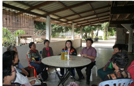
ภาพที่ 4 การประชุมกลุ่มย่อยด้านการพัฒนาผลิตภัณ์

ทันต่อการร้านค้าหรือผู้สั่ง สมาชิกกลุ่มจะมีการสื่อสารด้วยวิธีการต่าง ๆ ที่สามารถทำให้การผลิตสินค้าทำได้เร็วที่สุด เช่น การโทรศัพท์ไปแจ้งหรือการเดินทางไปแจ้งด้วยตนเองของผู้นำกลุ่มพร้อมชี้ให้เห็นถึงความสำคัญในการผลิตแต่ละรอบงาน