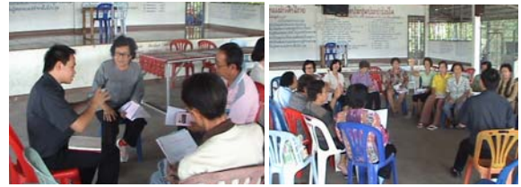
ภาพที่ 2 เวทีเสวนาบริบทกลุ่มช่วยเหลือใจ

กลุ่มช่วยเหลือใจเกิดขึ้นมาภายใต้การรวมกลุ่มของสมาชิกที่มาจาก 2 หมู่บ้านคือ หมู่ 1 และ หมู่ 9 ตำบลแม่ทะ ซึ่งจากเดิมคือหมู่ 1 แต่มีการแยกหมู่บ้านในภายหลังโดยเพิ่มหมู่ 9 ขึ้นมาซึ่งมีอาณาเขตติดกันกับหมู่ 1 เพื่อให้ง่ายต่อการบริหารจัดการชุมชน ซึ่งส่งผลให้สมาชิกของกลุ่มช่วยเหลือใจมาจาก 2 หมู่บ้าน โดยเริ่มดำเนินกิจกรรมด้านการรวมกลุ่มเมื่อประมาณ ปี 2552 จากจำนวนสมาชิกเริ่มต้นประมาณ 15 คน จนมีการเพิ่มขึ้นของสมาชิกในภายหลังจนมีสมาชิก 25 คนในปัจจุบัน โดยการรวมกลุ่มของประชาชนในบ้านแม่ทะหมู่ 1 และหมู่ 9 ภายใต้ชื่อกลุ่มช่วยเหลือใจ นั้นคือ คำว่า ช่วยใจ ในภาษาเหนือ หมายถึง การรวมน้ำใจของคนในชุมชนเดียวกันเพื่อการทำกิจกรรมร่วมกัน ดังนั้น จึงนำคำว่า ช่วยใจ มาเป็นชื่อกลุ่ม ตั้งแต่เริ่มแรกจนถึงปัจจุบัน โดยมีกิจกรรมในการสร้างงาน สร้างรายได้เสริมคือการผลิตน้ำมันหอมระเหย น้ำยาล้างอเนกประสงค์ ลูกประคบสมุนไพรและดอกไม้จัน จำหน่ายภายในชุมชน ซึ่งเงินทุนการดำเนินกิจกรรมของกลุ่มมาจากการเก็บกันเองของสมาชิกคนละ 100 บาท