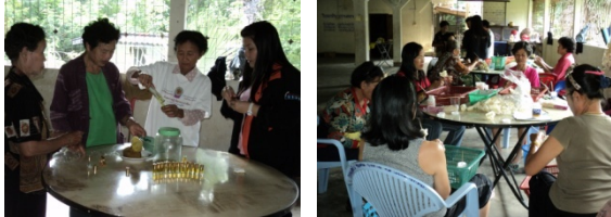
ภาพที่ 3 ทีมวิจัยลงพื้นที่ศึกษาผลิตภัณ์ของกลุ่มช่วยเหลือ

กลุ่มผู้สูงอายุ ดังนั้นการทำงานต่าง ๆ จะต้องใช้ระยะเวลาในการทำนานขึ้น รวมทั้งด้วยลักษณะทางกายภาพของแต่ละคนเป็นผู้สูงอายุ จึงส่งผลให้ความสามารถในการขยับตัว เดินหรือวิ่งของด้อยลง ดังนั้นการผลิตสินค้าบางประเภทเช่น น้ำยาล้างเนกประสงค์มักจะใช้ระยะเวลานานกว่าปกติ