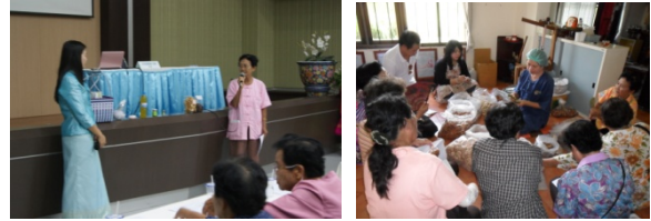
ภาพที่ 5 กิจกรรมการสร้างองค์ความรู้สำหรับสมาชิกกลุ่มช่วยใจ